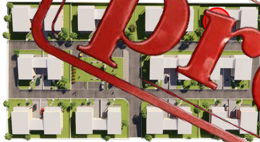
Via Mar Mediterraneo